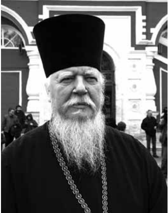
Протоиерей Дмитрий Смирнов

— Отец Димитрий, как Вы думаете, почему так быстро сокращается народонаселение России?