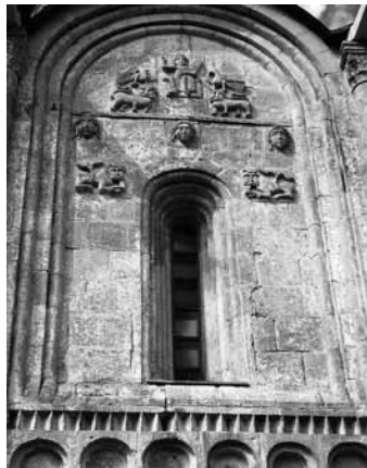
Рельеф храма Покрова на Нерли

Храм Покрова на Нерли по лаконичности и совершенству форм сравнивают с древнегреческими храмами. В настоящее время он, как и прежде, приписан к Боголюбовскому монастырю и внесён в Список Всемирного наследия ЮНЕСКО.