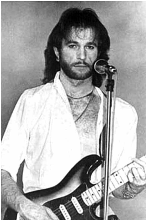
Игорь Тальков. 4.11.1956 — 6.10.1991

В состоянии хаоса, царившего в обществе и в душах, нужен был человек, который сможет пробудить общество от спячки, предостеречь от последнего шага, свержающего в бездну. Таким рупором стал Игорь Тальков. Простой человек, говорящий доступным языком о важных вещах. Собирающий по крупицам свой духовный опыт в духовно больной, истерзанной России, стоявшей на пороге новой жизни. «А верну я этот сброшенный крест в церковь Иоанна Предтечи только тогда, когда та епархия, в чьем ведомстве находится охрана исторических памятников русского зодчества, вспомнит