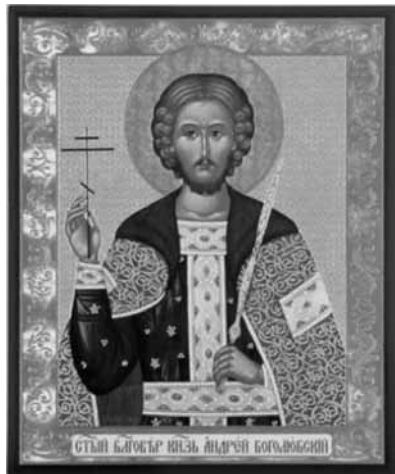
Святой благоверный князь Андрей Боголюбский