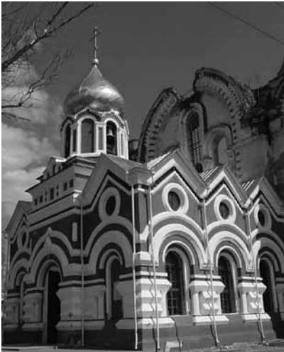
Иверский женский монастырь в Выксе

Нужен был какой-то период запустения, покаяния веры православной, наших истоков. Тот период, который нам отмерил Господь. Когда-то Он сорок лет