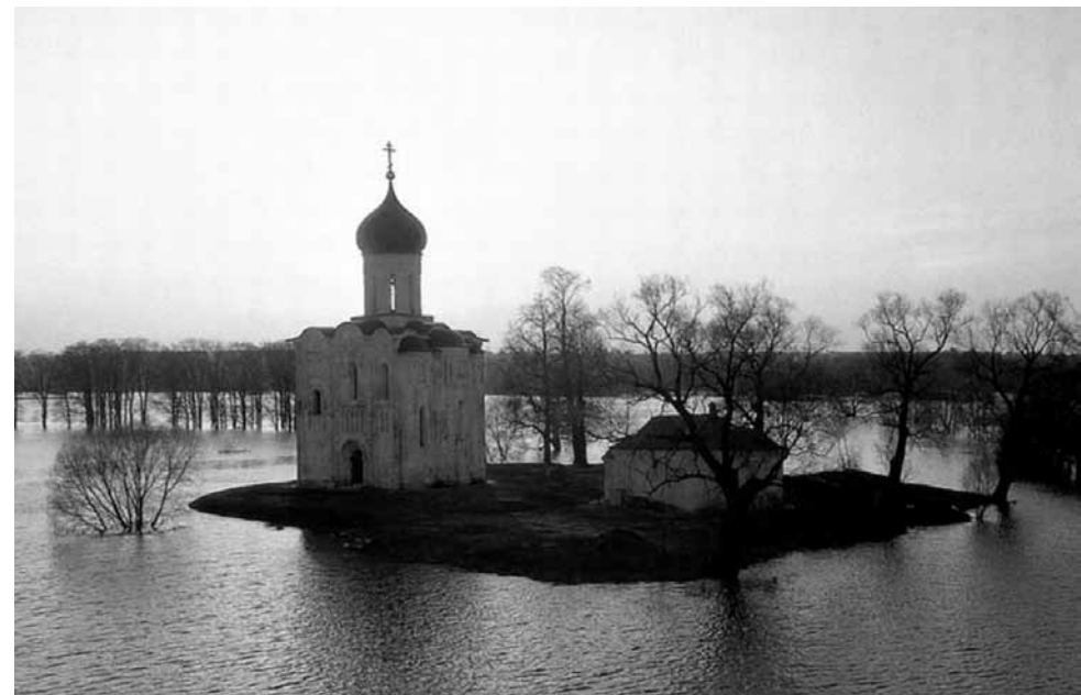
Храм Покрова на Нерли

Некогда Давид создал свой прекрасный и высочайший столп между Сионом, стоящим на высокой горе, и расположенным ниже Иерусалимом, называвшимся дочерью Сиона. И был тот столп между ними, как бы шея между телом и головою, ибо он своею высотой превосходил Иерусалим и достигал до Сиона. На том столпе были повешены щиты и все оружие, необходимые для войны и защиты Иерусалима. Дух Святой уподобляет Пречистую Деву сему столпу: яко столп Давидов выя твоя: тысяща щитов висит на нем, все стрелы сильны (Песн. 4, 4). Пресвятая Богородица, будучи дочерью Давидовой, является посредницей между Христом — Главою Церкви — и верующими, кои составляют тело Церкви. Она превосходит Церковь, потому что поистине выше всех ее членов,