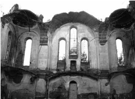
Выксунский монастырь. Разрушенный Троицкий собор

сих пор идут). Вот недавно пришла гуманитарная помощь из Омска и Чувашии. Из соседних районов присылали, из Дивеева и Нижнего Новгорода, из Тверской области, хотя там тоже были пожары. Наконец, из Московской Патриархии и вот от вас (от фонда «Русская Берёза», — МАД) много пожертвований приходило. Пожарные расчеты, отряды МЧС, военные, машины-водовозы прибыли из многих регионов России. Самое главное, что всё это было вовремя и необходимо. Например, когда ваш фонд привёз нам в бутылках питьевую воду, получилось так, что во всей округе вода была только в нашем монастыре. На какой-то момент своя вода у нас кончилась — осталась только ваша. У нас её брали и бойцы МЧС, и солдаты, и местные жители. Когда возникали перебои с какими-то поставками (например, с пайками), эти структуры обращались за помощью к нам. А когда возникали новые очаги пожаров, наши прихожане шли туда добровольно и сидели там днём и ночью. Мы же привозили воду и сухие пайки этим мужественным людям, измученным борьбой с огнём.