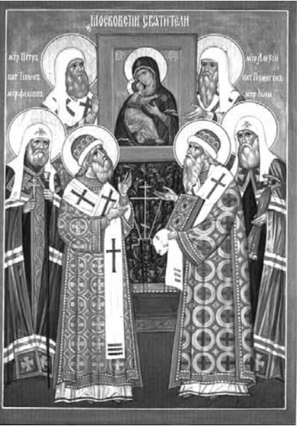
Собор Московских святителей: Петр, Филипп, Алексий, Еромоген, Иона, Тихон

С 1912 по 1917 г. митрополитом Московским и коломенским служил Макарий, также известный своими миссионерскими подвигами. Он проповедовал среди народов алтайского края, был начальником Алтайской духовной миссии. Он составил первый «Алтайский букварь», первую грамматику, перевел на язык местного населения богослужебные книги, в том числе литургию Иоанна Златоуста. В последние