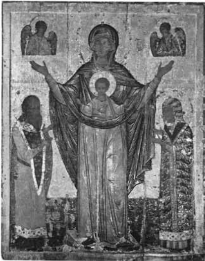
Мiroжская икона Божией Матери

скающая Своих подъятых рук Оранта — воистину Взбранная Воевода, по слову акафиста. Мiroжская обитель, основанная около 1156 г. в устье реки Мiroжи, — это древнейший монастырь Пскова. Обитель стала первым семенем монашества, перенесенным на псковскую почву из Киева. Со временем собор Спаса Преображения, первый монастырский храм, станет центром христианского просвещения в Пскове. Здесь спустя четыре века Мiroжская икона будет совершать чудеса во славу Божию и во спасение земли псковской. В рукописном сборнике, хранившемся в монастырской библиотеке, записано сказание о чуде Мiroжской иконы Божией Матери, произошедшем в 1567 г. Запись об этом событии составлена 28 лет спу-