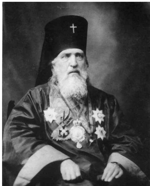
Святитель Николай Японский

вязано кем-то извне. Главное — не лениться анализировать себя, окружающий мир, людей. Анализировать, но не судить — хоть отрицательно, хоть положительно».