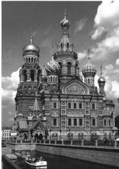
Храм Спаса на Крови воздвигнут на месте убийства царя Александра II.

Раньше корень зла он видел в монархе. Из заключения пишет своей жене: «Положись на Всевышнего и милосердие государя».