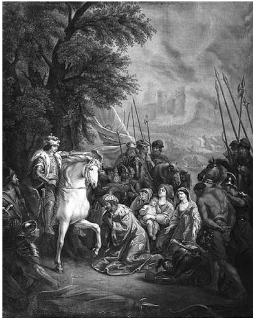
Взятие Казани Иваном Грозным. Художник Г.И. Угрюмов

Увидев город, выросший у них на глазах, казанцы испугались и стали просить царя, чтобы прислал им на престол ещё недавно изгнанного хана Шигалея. Царь согласился и даже щедро наградил казанцев. Но неумные и коварные казанцы в скором времени снова замыслили худое, вознамерившись убить хана Шигалея. Прослышав об