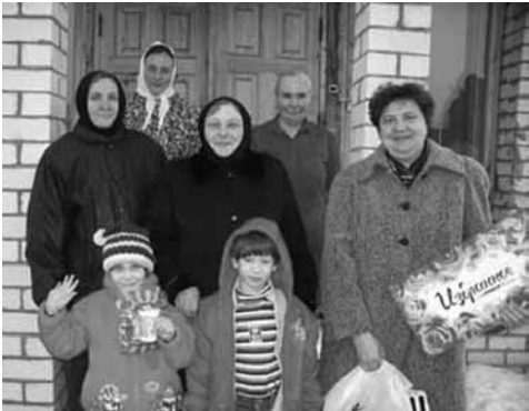
Приют для девочек.

— Я никак не могу маленькую вот эту нашу трагедию сравнить с Великой Отечественной. Единственное, могу согласиться с тем, что люди пережили похожий страх, увидев кусочек огня, который полыхал в 1941-1945 гг. над всей нашей страной. Но они не видели вокруг насилия.