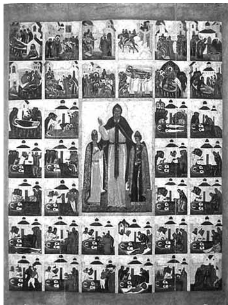
Святые благоверные князья Феодор, Давид и Константин

Огромное влияние, которое святой Феодор приобрел в Орде, он использовал во славу Русской земли и Русской Церкви. Православие все более укреплялось среди татар, ордынцы усваивали русские обычаи, нравы