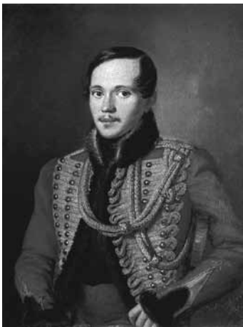
Михаил Юрьевич Лермонтов. Работа художника П.Е. Заболоцкого. 1837 г.

ходило не просто. Тем не менее, мальчика примиряла с жизнью прекрасная природа, а отличное домашнее образование способствовало нравственному и духовному развитию будущего поэта: «Моя душа, я помню, с детских лет чудесного искала...» Затем в жизни поэта была учеба в Московском благородном пансионе, поступление в Московский университет и, наконец, переезд в Петербург и поступление в школу гвардейских подпрапорщиков и кавалерийских юнкеров. После чего последовала служба в лейб-гвардии Гусарском полку. К этому времени (1835 г.) относится и первое появление Лермонтова в печати. До тех пор Лермонтов был известен, как поэт, лишь в офицерских и светских кругах. В этот период в его творчестве наиболее четко проявляется народная тематика, воссоздание русского народного характера («Песня про царя Ивана Васильевича...», 1838 г., «Бородино», 1837 г., «Завещание», 1840 г., «Родина», 1841 г.). Ключевым в жизни поэта явился и 1837 г., в котором за распространение последних 16 строк стихотворения «Смерть поэта» (стихотворение было откликом на гибель Пушкина) Лермонтов был арестован по приказу самого царя, а затем переведён в