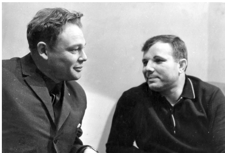
Два Юрия: Быков и Гагарин

Накануне в 1963 году Быков поступает в Школу лётчиков-испытателей при Лётно-Исследовательском Инсти-