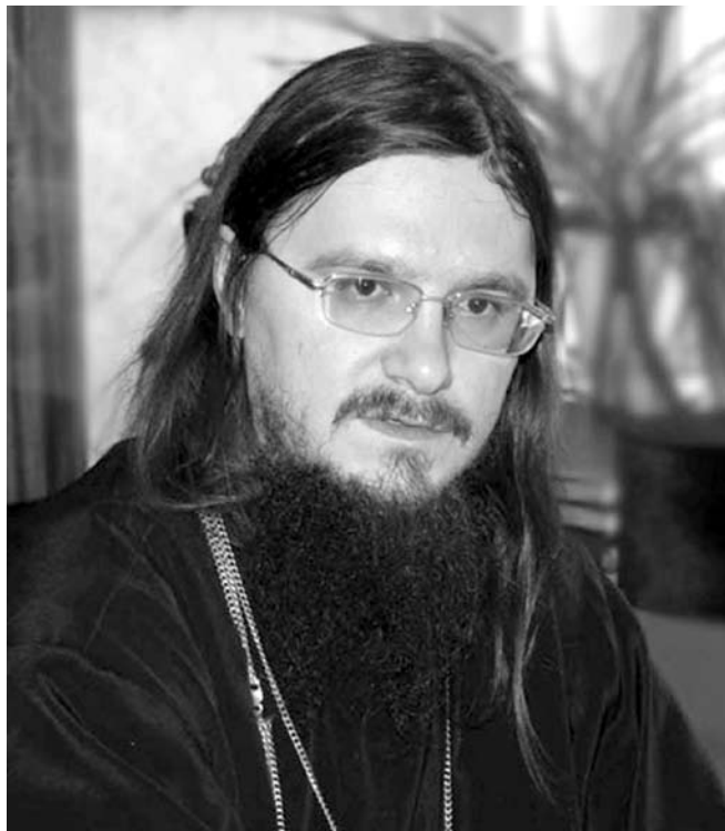
Священник Даниил Сысоев