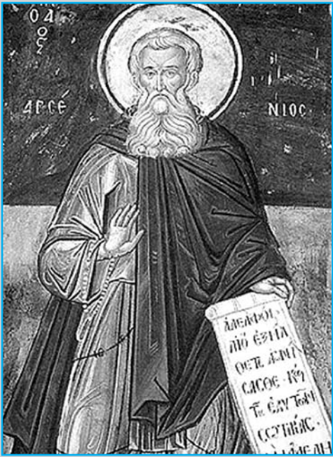
Преподобный Арсений Великий

Арсений, благословив в душе своей Феодосия, с того времени начал преподавать уроки сидя, а царевичи стояли пред ним.