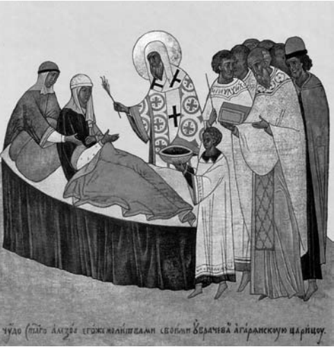
Святитель Алексей исцеляет ханшу Тайдулу

«Приложись, ангел мой, к мощам святителя