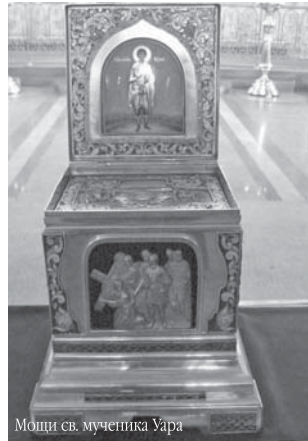
Мощи св. мученика Уара